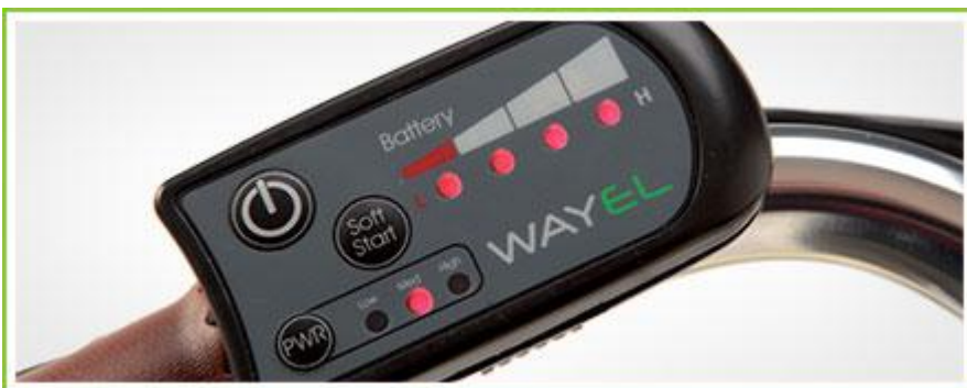
Multifunkcijska kontrolna enota nam omogoča izbiro med 3 različnimi stopnjami asistenc in pri speljevanju do 6 km/h.