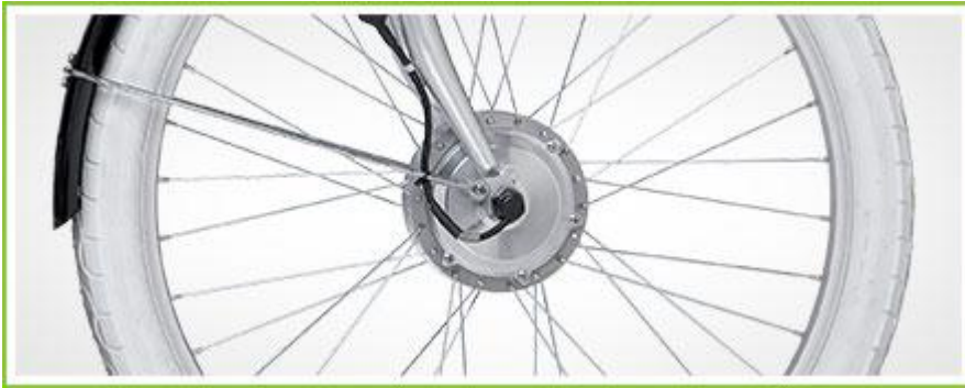
Brezkrtični 180W/15Nm motor.